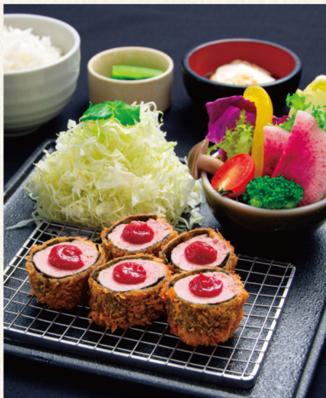
しそ梅のり巻きとんかつ膳 1980