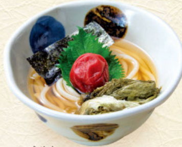
うめか 梅香 税込 960 円