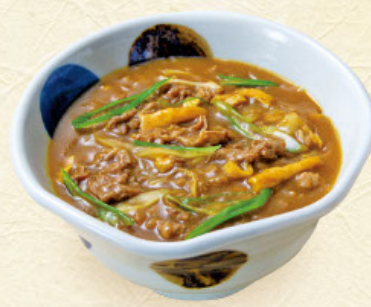
カレー 税込 1,190 円