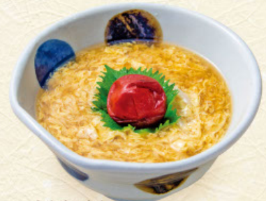
うめけいらん 梅鶏卵 税込 990 円