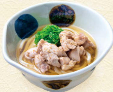
とりねぎ 税込 1,030 円