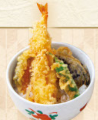
ミニ天丼 税込 680 円

※当店は国内産のお米を使用しております。 ※季節により食材又は盛り付け、器などが変わる場合がございます。