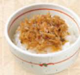
ちりめん山椒ご飯 税込 320 円