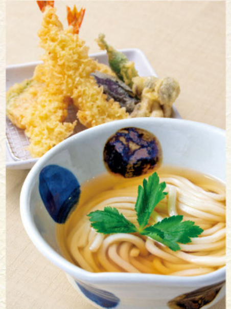
天ぷらうどん 税込1,480円 またはそば