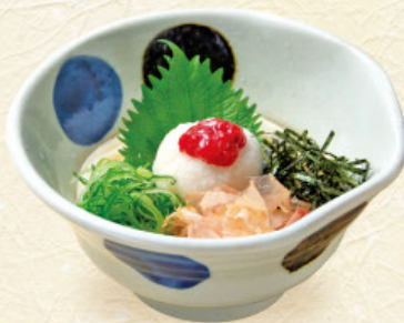
梅おろし 税込 960円 うどんまたはそば