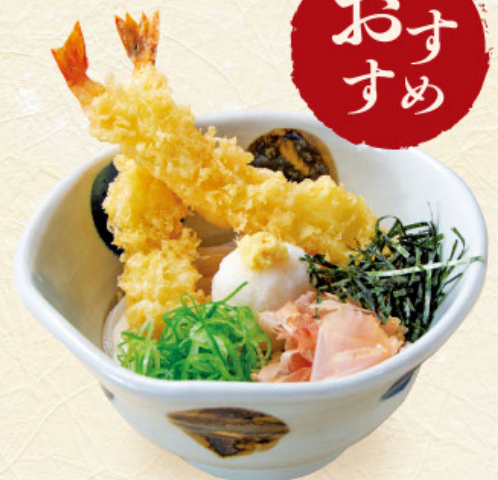
海老天おろし 税込 1,160円 うどんまたはそば