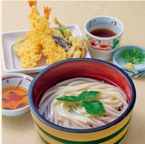
天ぷら湯だめ 税込1,480円