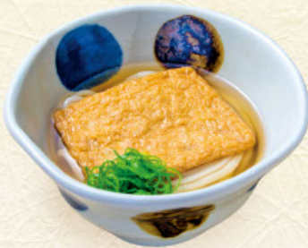
きつね 税込790円 うどんまたはそば