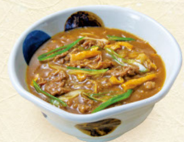
カレー 税込1,190円 うどんまたはそば