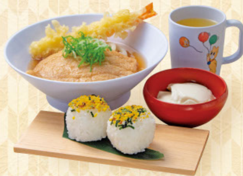
おこさまうどんセット 税込860円