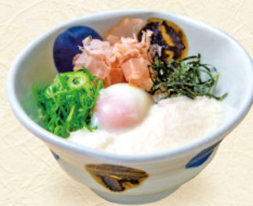
やまかけ 税込 960円 うどんまたはそば