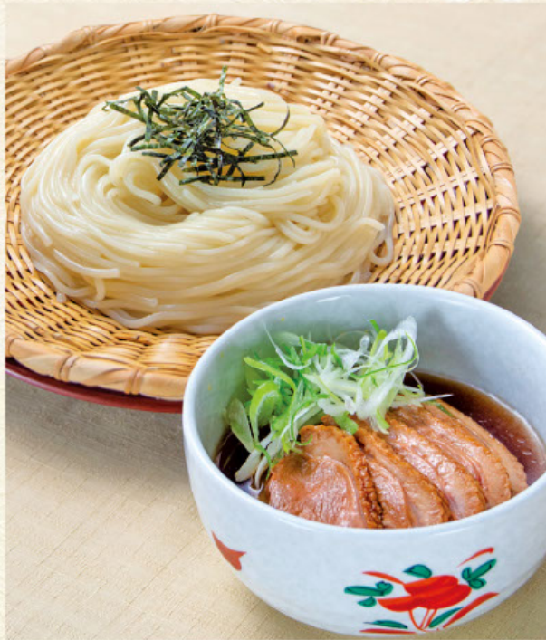
鴨汁つけうどん 税込 1,190円 またはそば