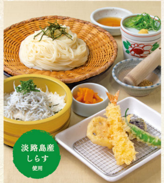
しらす丼定食 税込1,480円

しらす丼、天ぷら盛り合わせ、漬物 かけうどん(そば) 温 または ざるうどん(そば) 冷