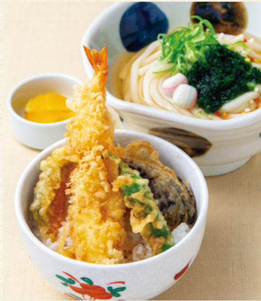
姫天丼定食 税込1,380円