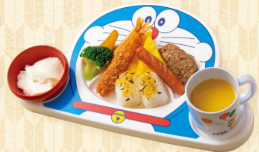
おこさまランチ 税込980円

海老フライ、ポテトフライ、ウィンナー オムレツ、ハンバーグ 手まりご飯、デザート、ジュース