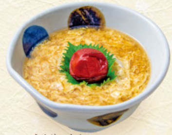
うめけいらん 梅鶏卵 税込990円 うどんまたはそば