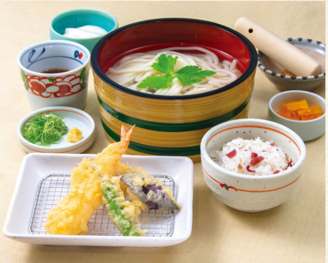
しゅんさい 旬菜 税込 1,340円