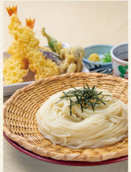
天ぷらざる 税込 1,480円 うどんまたはそば