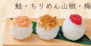
花むすび 税込 380円