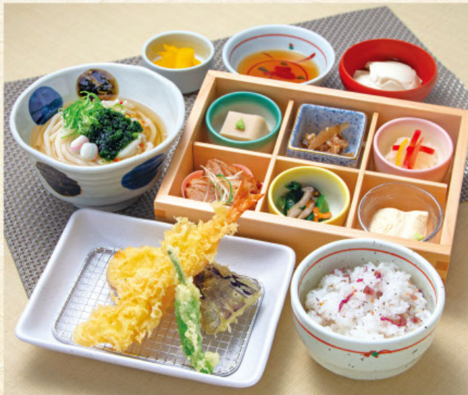
四季 税込 1,680円

天ぶら盛り合わせ、おばんざい6種 半玉うどん または そば 季節ご飯、漬物、デザート