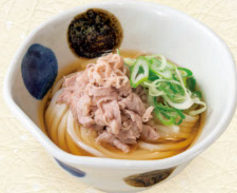
肉うどん 税込1,190円 うどんまたはそば