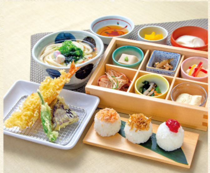
花かざり 税込 1,680円

天ぶら盛り合わせ、おばんざい6種 半玉うどん または そば 季節ご飯、漬物、デザート