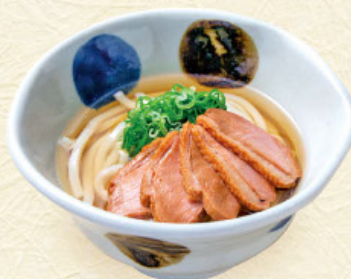
鳴ねぎ 税込1,190円 うどんまたはそば 合鴨使用