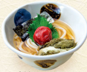
うめか 梅香 税込960円 うどんまたはそば