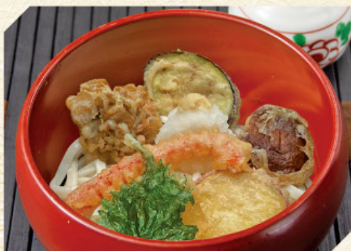
野菜天ぷらおろし 税込1,080円