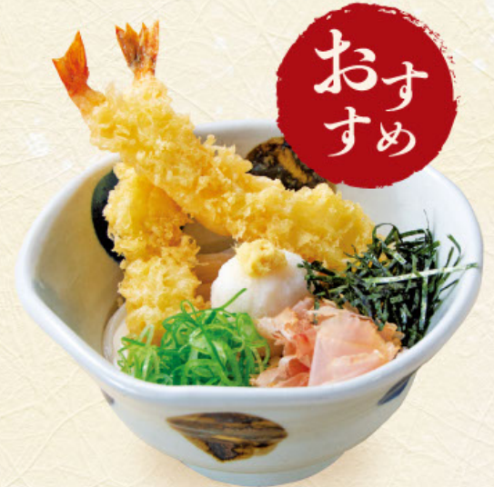
海老天おろし 税込 1,180円