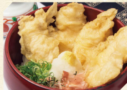
とり天おろし 税込1,180円