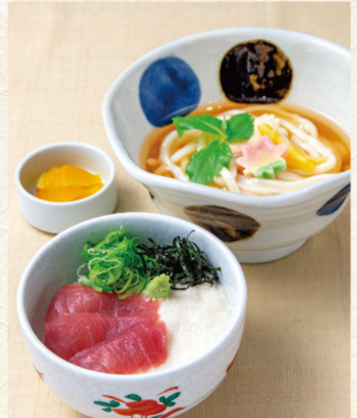
まぐろ山かけ丼定食 税込 1,450 円