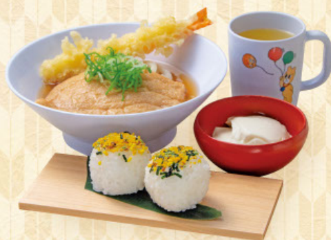
おこさまうどんセット 税込 860 円