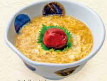
うめけいらん 梅鶏卵 税込 1,000円