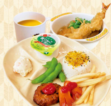
おこさま御膳 税込 1000 円

お子様うどん（きつね揚げ、海老天1本）、枝豆 ウインナー、ポテトフライ、ポテトサラダ ハンバーグ、ふりかけご飯、デザート、ジュース