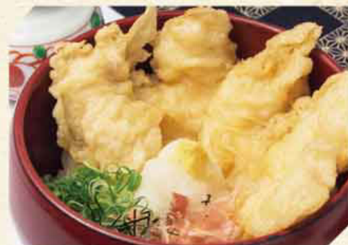
とり天おろし 税込1,180円