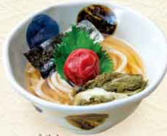
うめか 梅香 税込 960円