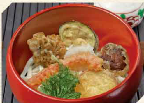
野菜天ぷらおろし 税込1,080円