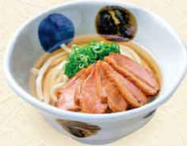
鴨ねぎ 税込 1,190円 合鴨使用