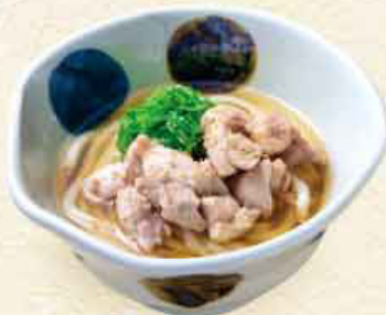
とりねぎ 税込 1,080円