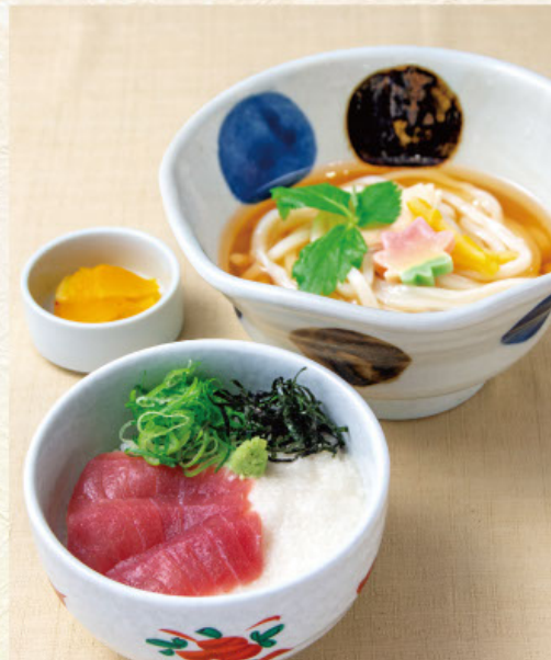
まぐろ山かけ丼定食 税込 1,450 円