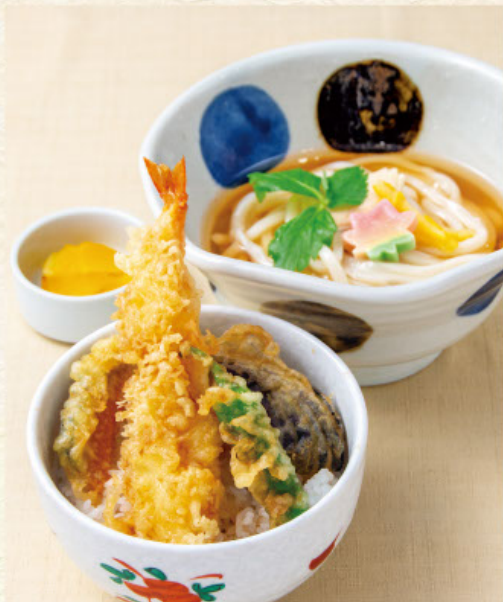
姫天丼定食 税込 1,430 円