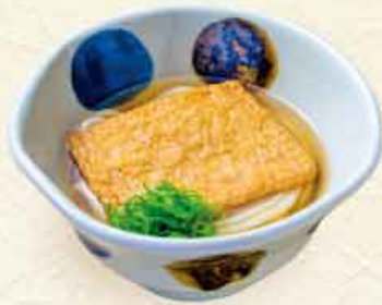
きつね 税込 790円